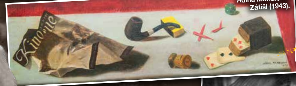
Adina Mandlová: Zátěší (1943).