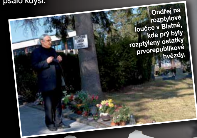
Ondřej na rozptylové loučce v Blatné, kde prý byly rozptýleny ostatky prvorepublikové hvězdy.

Poslední lednový týden jsme si připomínali už 105. výročí narození filmové hvězdy Adiny Mandlové (†81). Opět jsme se dočetli, že její popel byl rozptýlen na rozptylové loučce u hřbitova v jihočeské Blatné – vzdor tomu, co se psalo kdysi.