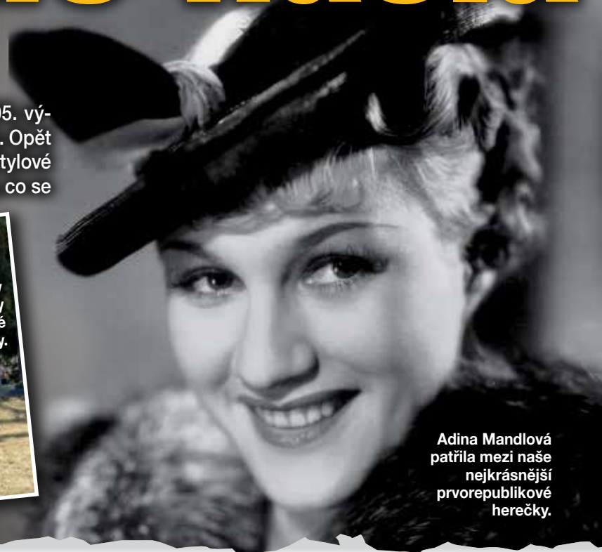
Adina Mandlová patřila mezi naše nejkrásnější prvorepublikové herečky.