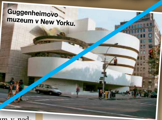
Guggenheimovo muzeum v New Yorku.

studentů. Bylo nutné projít dost náročným pohovorem, napsat velmi dobrou esej a pak ještě dvě konzultace s kurátory. Mám velkou radost, že si vybrali právě naši Kláru. Guggenheim Museum je muzeum v nadčasové budově vystavující kvalitní sbírku moderního umění 19. a 20. století. Patří mezi nejslavnější muzea v New Yorku a leží v oblasti Upper East Side. Guggenheimovo muzeum založil velmi bohatý podnikatel Solomon R. Guggenheim, který pocházel ze staré švýcarské rodiny, jež vlastnila měděné doly. Budova muzea je velmi zajímavá, neboť je kruhovitá až spirálovitá a do urbanistiky této části New Yorku příliš nezapadá. Opening se konal v roce 1959, takže na tu dobu to byla velmi moderní a odvážná stavba a odborníky nebyla pozitivně kvitována. Ale postupem času právě naopak odborníci v oblasti architektury přehodnotili svůj